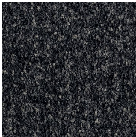
Negro de diseño 81.01